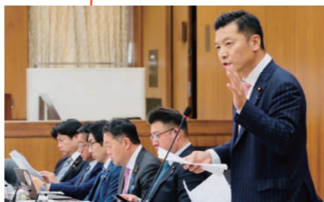
農林水産委員会で質疑