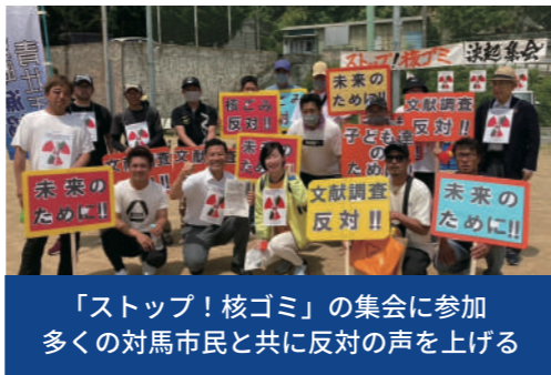
「ストップ! 核ゴミ」の集会に参加 多くの対馬市民と共に反対の声を上げる