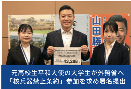
元高校生平和大使の大学生が外務省へ「核兵器禁止条約」参加を求め署名提出