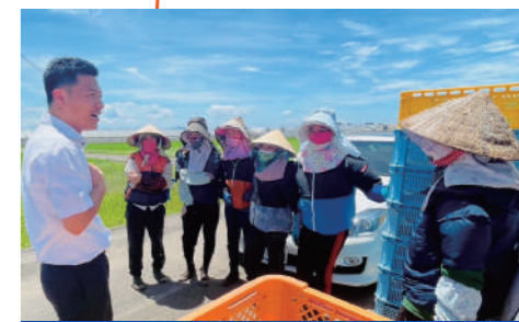
日本で働く技能実習生から話しを伺う