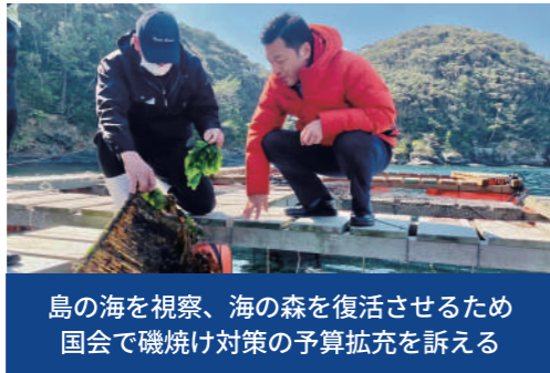
島の海を視察、海の森を復活させるため国会で磯焼け対策の予算拡充を訴える