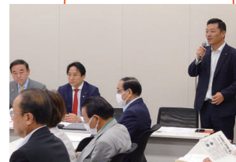
超党派の国会議員 49 名が参加