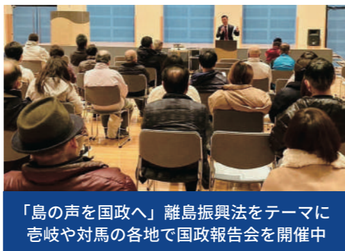
「島の声を国政へ」離島振興法をテーマに島嶼や対馬の各地で国政報告会を開催中