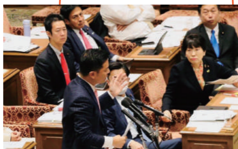
法務・文科・消費者連合審査会