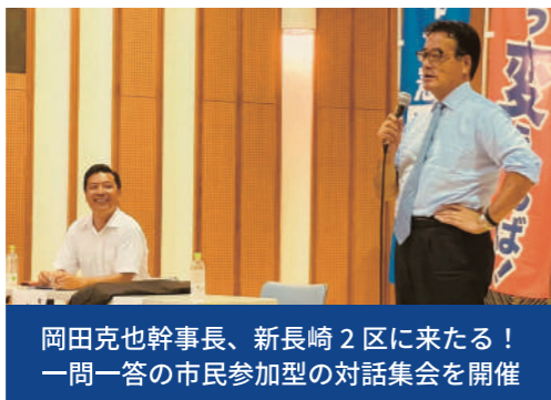
岡田克也幹事長、新長崎2区に来たる！一問一答の市民参加型の対話集会を開催