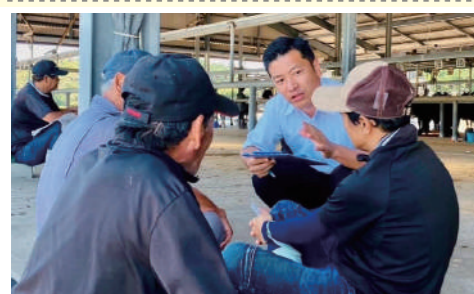
吉岐家畜市場で切実な声を伺う

金融支援について。すでに、農水省から全国各地の JA グループや各金融機関へ畜産経営者に対し、既存の貸付金の返済猶予などの金融支援を求める公文書が通知されています。しかし、現場の生産者にその情報が全く届いていない問題を指摘しました。農林水産大臣からは、 農水省をあげて金融支援に取り組み、周知徹底に努めると答弁がありました。 その他、市場価格の暴落で赤字となる分を補填する制度を地域の実情に合わせ、セーフティネット機能を強化すること、さらに、飼料高騰対策の補填額の大幅な引き上げを訴えました。