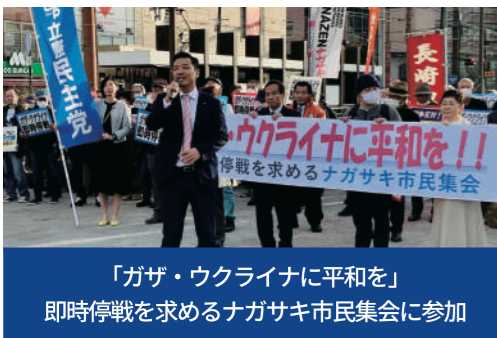
「ガザ・ウクライナに平和を」即時停戦を求めるナガサキ市民集会に参加