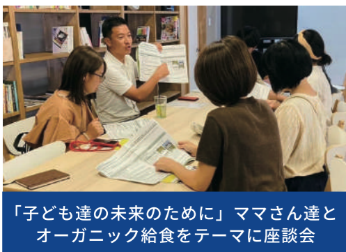
「子ども達の未来のために」ママさん達とオーガニック給食をテーマに座談会