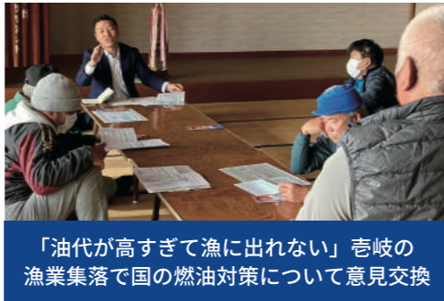
「油代が高すぎて漁に出れない」 島嶼の漁業集落で国の燃油対策について意見交換