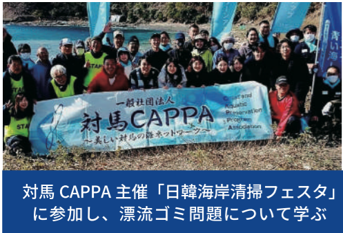
対馬CAPPA主催「日韓海岸清掃フェスタ」に参加し、漂流ゴミ問題について学ぶ