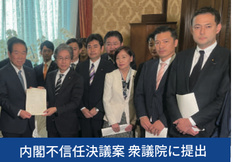
内閣不信任決議案 衆議院に提出